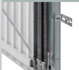
3 sistem vzmetenja

Sistem vzmetenja z zaščito pred ukleščanjem prstov razporedi težo vratnega krila na več vzmeti. Vsaka vzmet je zavarovana tako, da ob morebitnem lomu ne odleti v prostor, kar bi povzročilo poškodbe. Tudi razmik navojev je tako majhen, da ne more priti do ukleščanja.