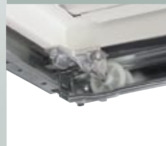
4 vdolbina za mehko ustavljanje tekalnih kolesc

Vrata se varno ustavijo v vdolbini na koncu vodila.