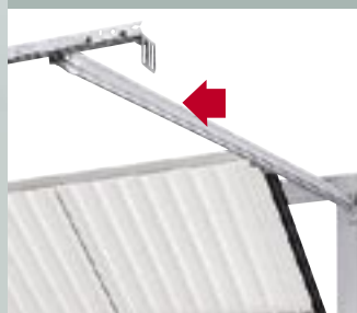
2 stropno vodilo

Zelo natančno vodilo preprečuje iztirjenje vratnega krila.